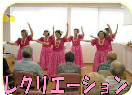
レクリエーション