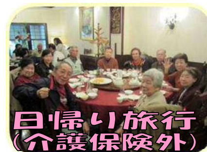
日帰り旅行 (介護保険外)