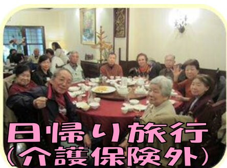
日帰り旅行 (介護保険外)