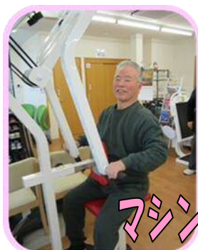
マシンを使ったリハビリテーション